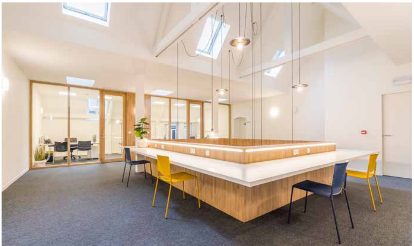
Het Ondernemerscentrum Brugge, op het Jan Van Eyckplein, creëerde via modernisering extra ruimte voor starters.

Hoe is het markante fenomeen van de aanhoudende startershausse tijdens vooral het tweede jaar van de